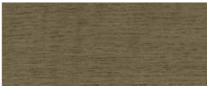
0637 Steingrau Neu