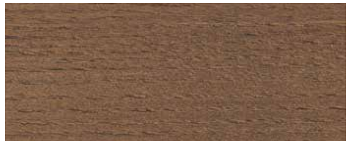
9052 Eksotisk Tre