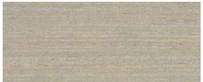
LO DB 701 + Zugabe Mixol Silber 3-5%