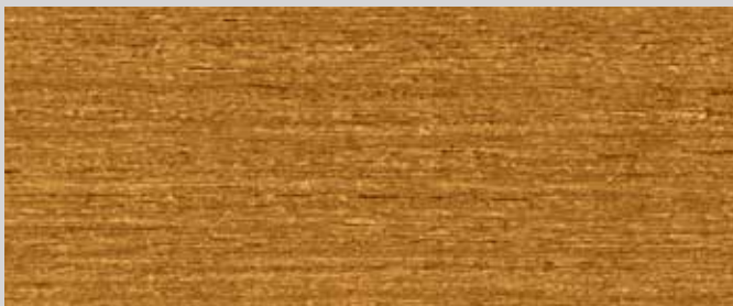
10083 Eiche Antik