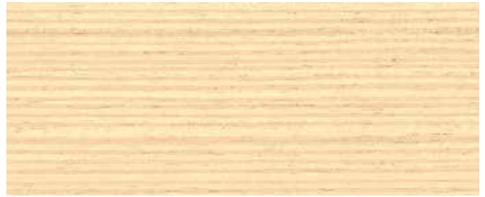
LO 10709 Oljavit