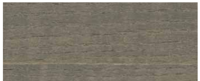
LO 9710 Fassadegrå