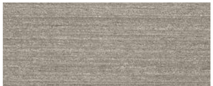
LO DB 703 + Zugabe Mixol Silber 3-5%