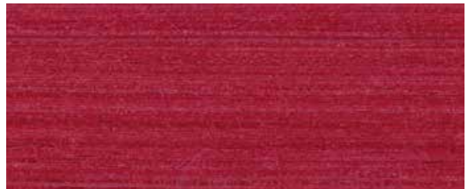
LO 9733 Skandinavischrot