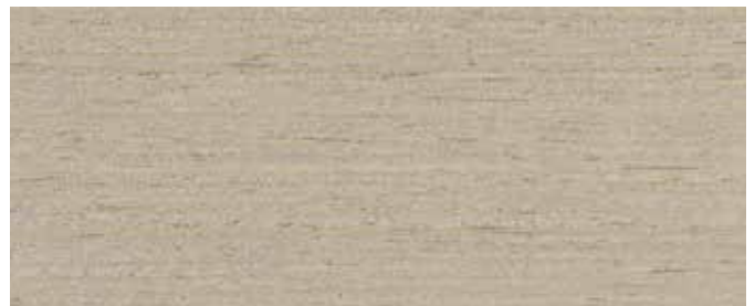
9073 Shimmergra + Zugabe Mixol Silber 3-5%