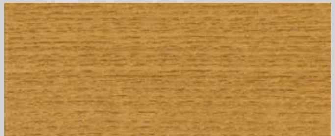
10083 Eiche Antik