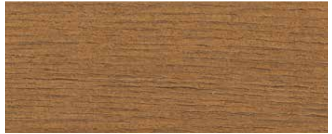
LO 90000 Fassadebrun