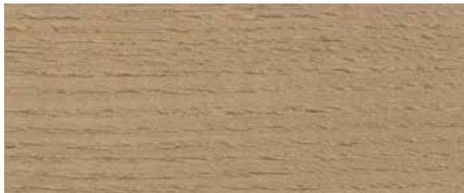
9074 Nordisk Tre