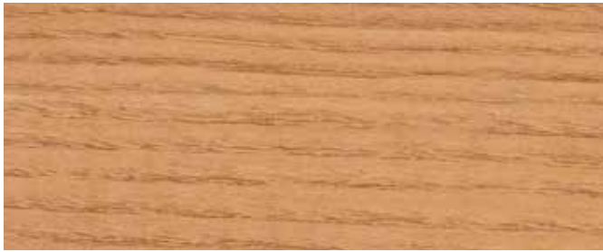
0935 Sibirische Lärche