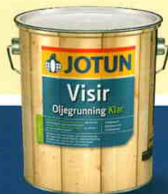
VISIR OLJEGRUNNING KLAR

Neu ist die Zusammensetzung von VISIR Oljegrunding Pigmentert, basierend auf langölgigen Alkyden. Diese besonderen Alkyde sind wasser verdünnbar und ermöglichen lösemittelarme, wasserbasierende Anstrichsysteme. Dabei konnte die Funktion und die Wirksamkeit gegenüber den lösemittelhaltigen Systemen sogar teilweise verbessert werden! Darüber hinaus ist auch diese Qualität mit fungiziden Wirkstoffen ausgestattet.