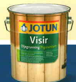
VISIR OLJEGRUNNING PIGMENTERT